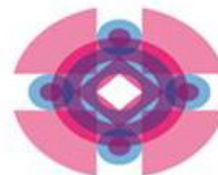
Scuola è Bologna